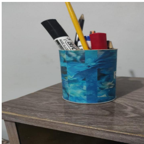
(Resultado da atividade de práticas sustentáveis- ADM 40 - unidade Fortaleza)